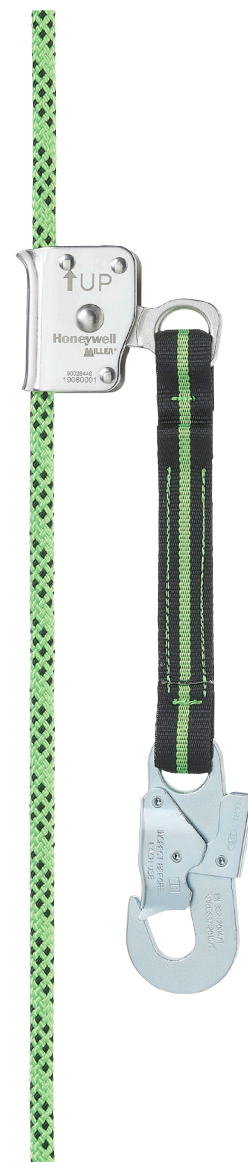
Automatisches RG300, Ø11 mm mit Anschlag 5 Meter