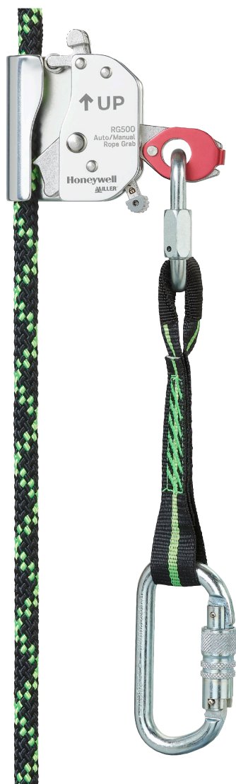
RG500 Auto/manuell, Ø12 mm mit Positionierungsseil-Erweiterung 0,3 m