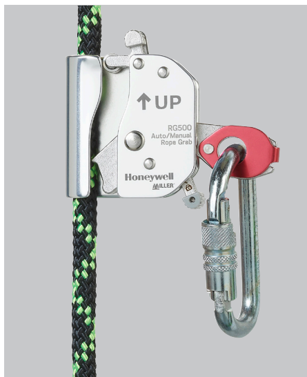
RG500 Auto/manuell, Ø12 mm ohne Positionierungsseil-Erweiterung