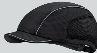
Basecap Flexactive mit 3,5cm Schirmlänge in der Farbe Tiefschwarz