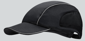
Basecap Flexactive mit 6,5cm Schirmlänge in der Farbe Tiefschwarz